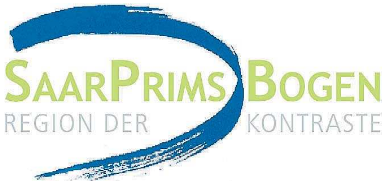
Das neue Logo der Region SaarPrimsBogen.

Ein Integriertes Ländliches Entwicklungskonzept (ILEK) ist Grundlage eines langfristigen regionalen Entwicklungsprozesses. Anders als der Saargau oder der Bliesgau hat die Region SaarPrimsBogen keine historischen Wurzeln und (noch) keine eigene Identität. Bereits zu Beginn des ILEK-Prozesses habe sich aber gezeigt, dass die Region eine Fülle spannender Projekte und Ideen aufweist, die – jede für sich – nur lokal wahrgenommen werden. Die fünf Verwaltungschefs haben sich deshalb auf folgende Vorgehensweise verständigt: Die vorhandenen Potenziale werden ermittelt, gebündelt und vernetzt und so zu regionalen Projekten mit großer Ausstrahlung entwickelt. Die drei Themenschwerpunkte Tourismus/Freizeit, Energie/Klima und Menschen stehen künftig für die Region und repräsentieren sie nach außen. nb