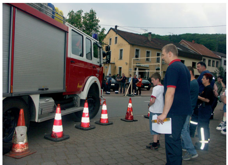
Fahrerisches Können wurde wieder beim Geschicklichkeitsfahren des Kreisfeuerwehrverbandes gezeigt